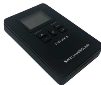
WIL-DLR400-ALK Mottager for standard alkaliske batterier AAA

For tilkobling mot et lydanlegg, eller annen intercom sentral benyttes dockingen DWD-401 med en DLT-400-C eller DLR-400-RCH