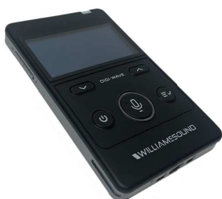
WIL-DLT400-C Tranceiver (= Sender & mottager )

Mange forskjellige øretelefon og mikrofonkombinasjoner å velge mellom.