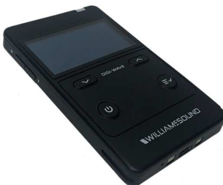
WIL-DLR400-RCH Mottager - Oppladbar